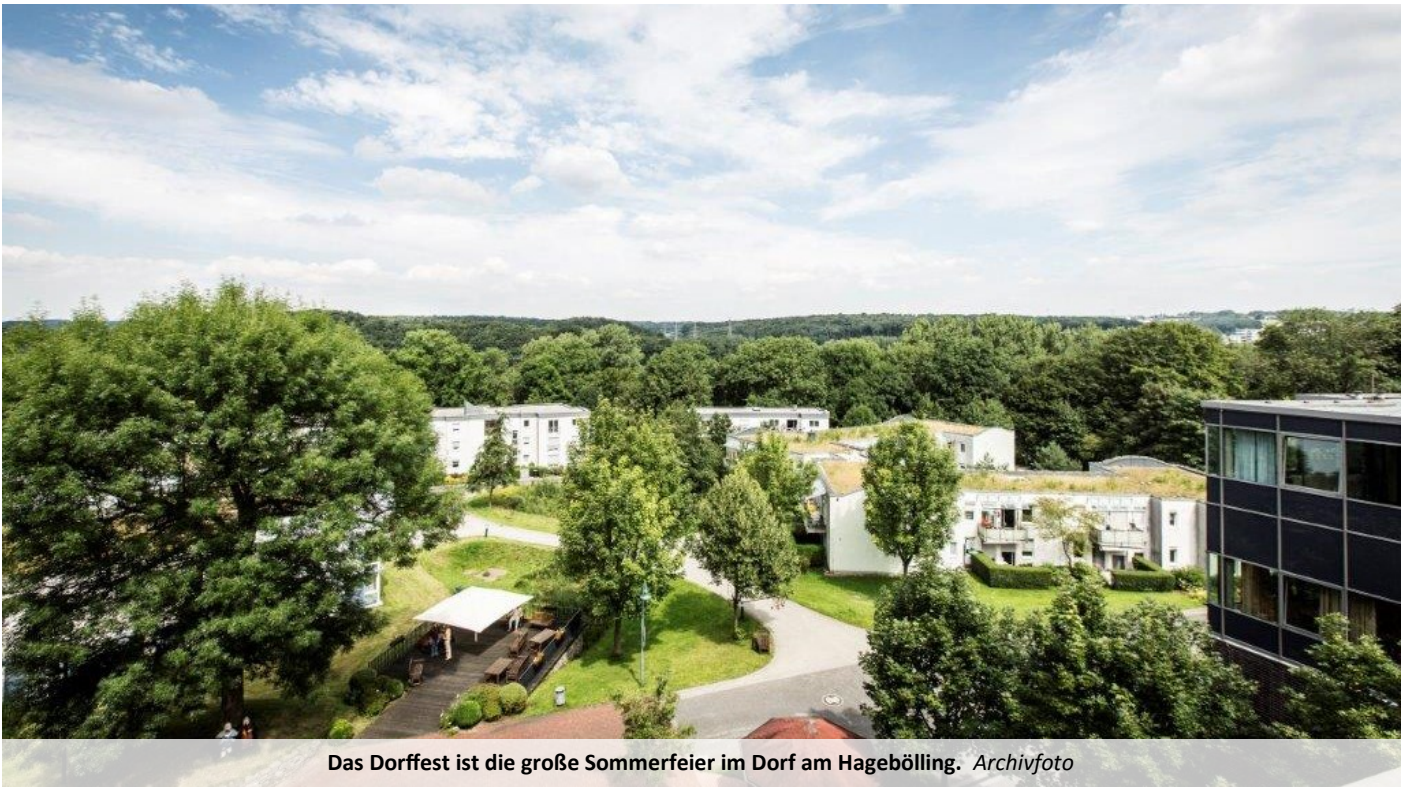
Das Dorffest ist die große Sommerfeier im Dorf am Hagebölling.

Jubiläum wird groß gefeiert am 2. September