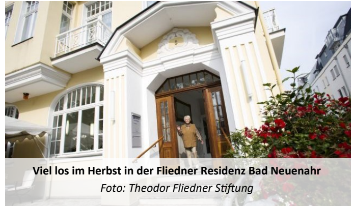
Viel los im Herbst in der Fliedner Residenz Bad Neuenahr