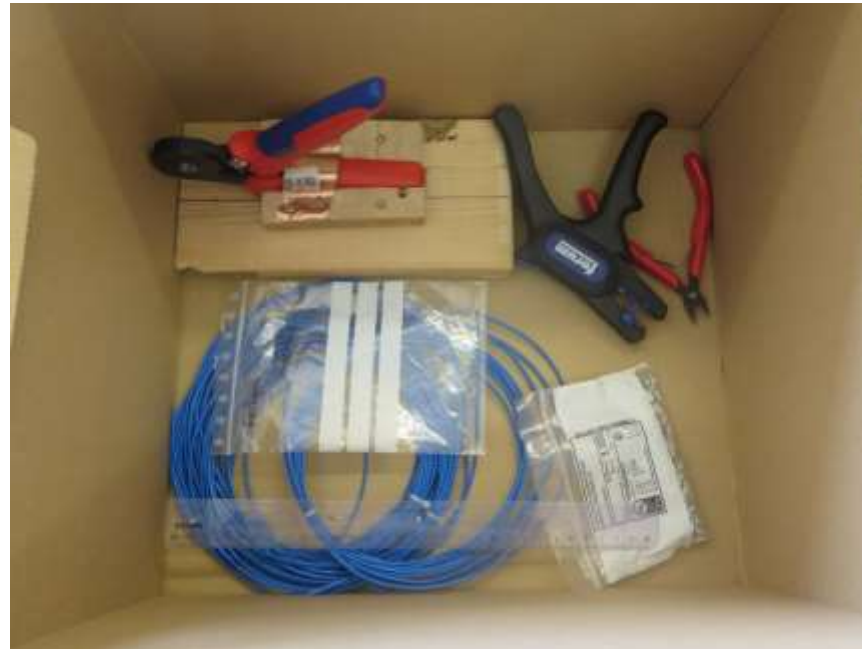
Kiste 2 (Mittel)